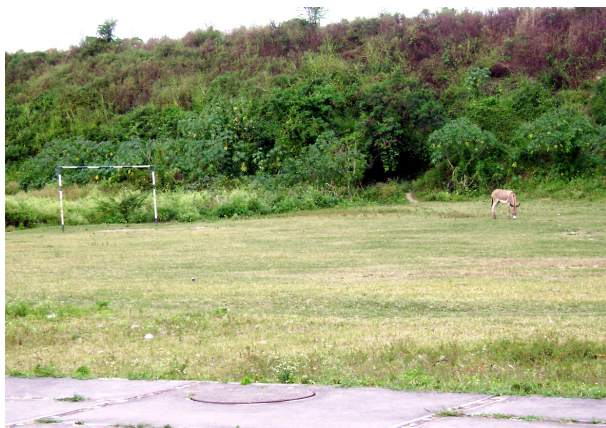
Imagem 04: Campos improvisados: opção de lazer disputada por todas as espécies

Em se tratando do esporte recreativo dos moradores de Bodocongó, pudemos observar a presença constante do futebol, que ora disputando espaço com os carros, nas ruas movimentadas do bairro, ora convivendo com animais de diversos tipos e condições de saúde, insiste em se perpetuar, principalmente nos campos improvisados que ainda existem no local.